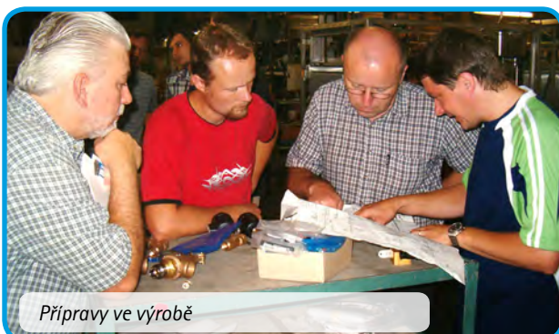
Přípravy ve výrobě