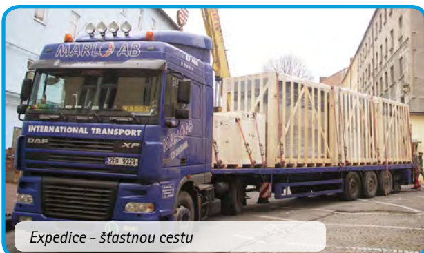
Expedice - šťastnou cestu

V letošním roce jsme pojmenování města Baltimore v USA skloňovali v mnoha pádech.