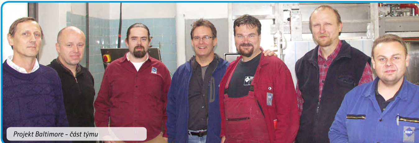
Projekt Baltimore - část týmu